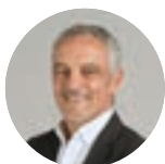
WILFRID DE VREESE maire d'Osthoffen