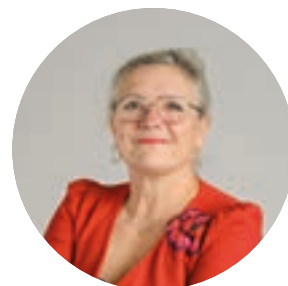
BÉATRICE BULO maire de Mundolsheim, vice-présidente → Propreté, réduction et valorisation des déchets