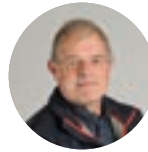
VALENTIN RABOT maire d'Achenheim