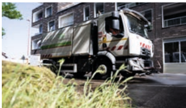
Trois heures d'intervention qui nécessitent l'absence de voitures de stationnement.