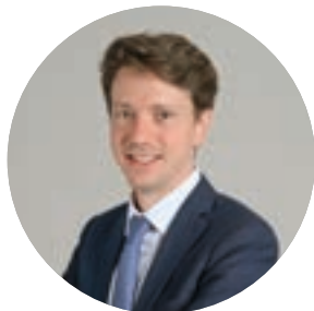
ÉTIENNE WESTPHAL conseiller municipal de Strasbourg, vice-président → Politique foncière et immobilière → Politique de l'habitat