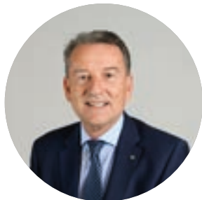
YVES SUBLON maire d'Eschau, vice-président → Politique des achats et commande publique