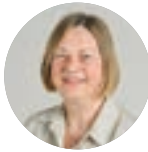
ANNIE KESSOURI maire de Kolbsheim