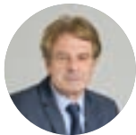
VINCENT DEBÈS maire d'Hoenheim