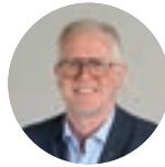
THIERRY SCHAAL maire de Fegersheim