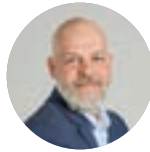
ALEXANDRE LORENTZ maire de Mittelhausbergen