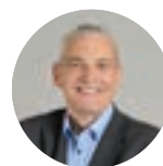
VINCENT SCHALCK maire de Holtzheim