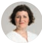
JEANNE BARSEGHIAN Strasbourg