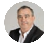
PIERRE PERRIN maire de Souffelweyersheim