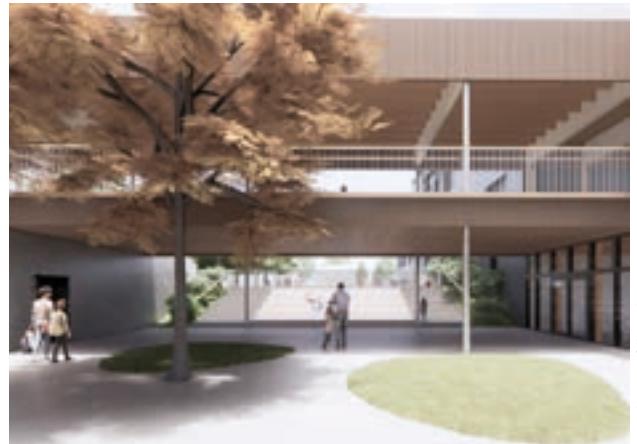
Le budget prévisionnel des travaux de ce « campus scolaire » s'élève à 9,7 millions d'euros HT.